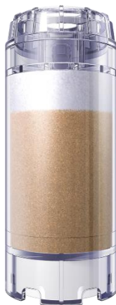
арт. 750 006