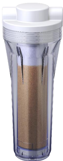
арт. 750 005